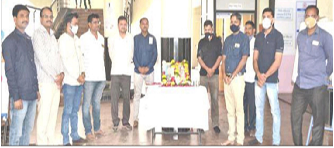
Celebration of Subhashchandra Bose jayanti at main porch