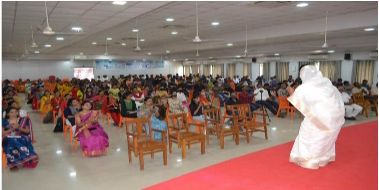
Hon.chief guest delivering speech