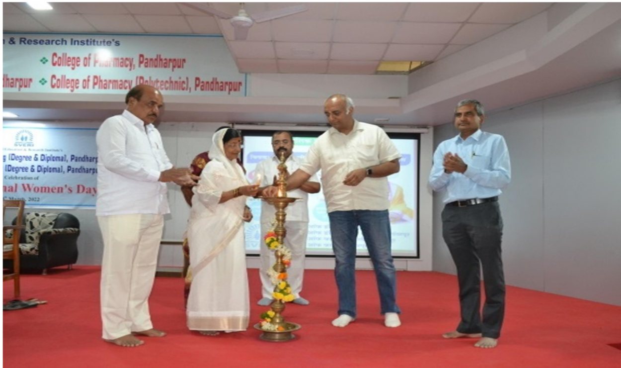
Lamp lighting ceremony by Hon.Chandatai Tiwadi