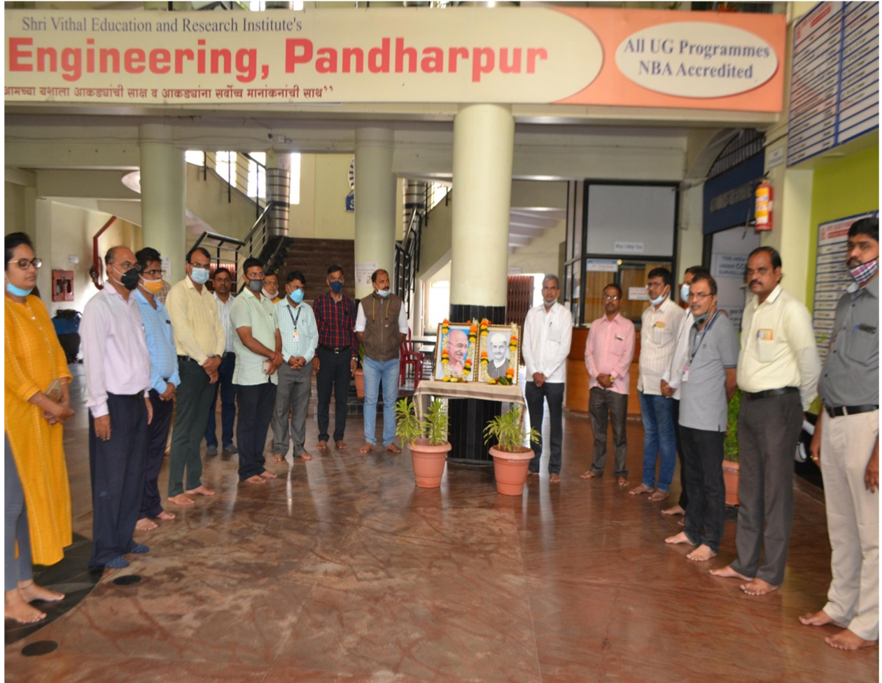
Celebration of Mahatma Gandhi Jayanti at main porch