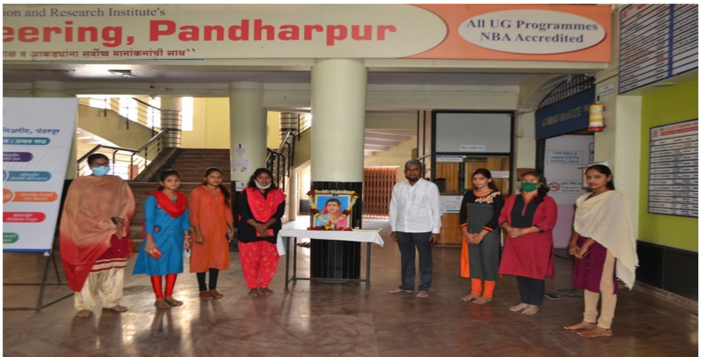
Celebration of Ahilyadevi Holkar Jayanti with college staff