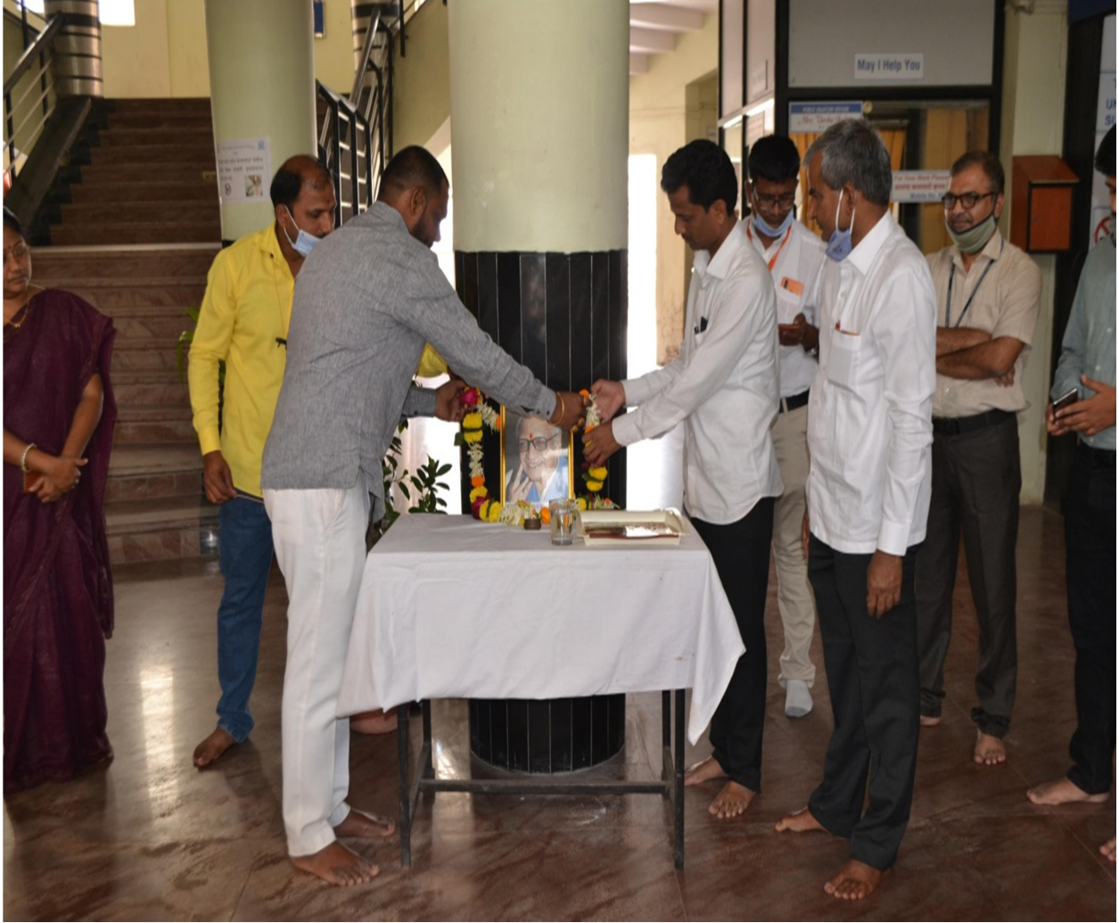
Celebration of Kusumagraj Jayanti at main porch