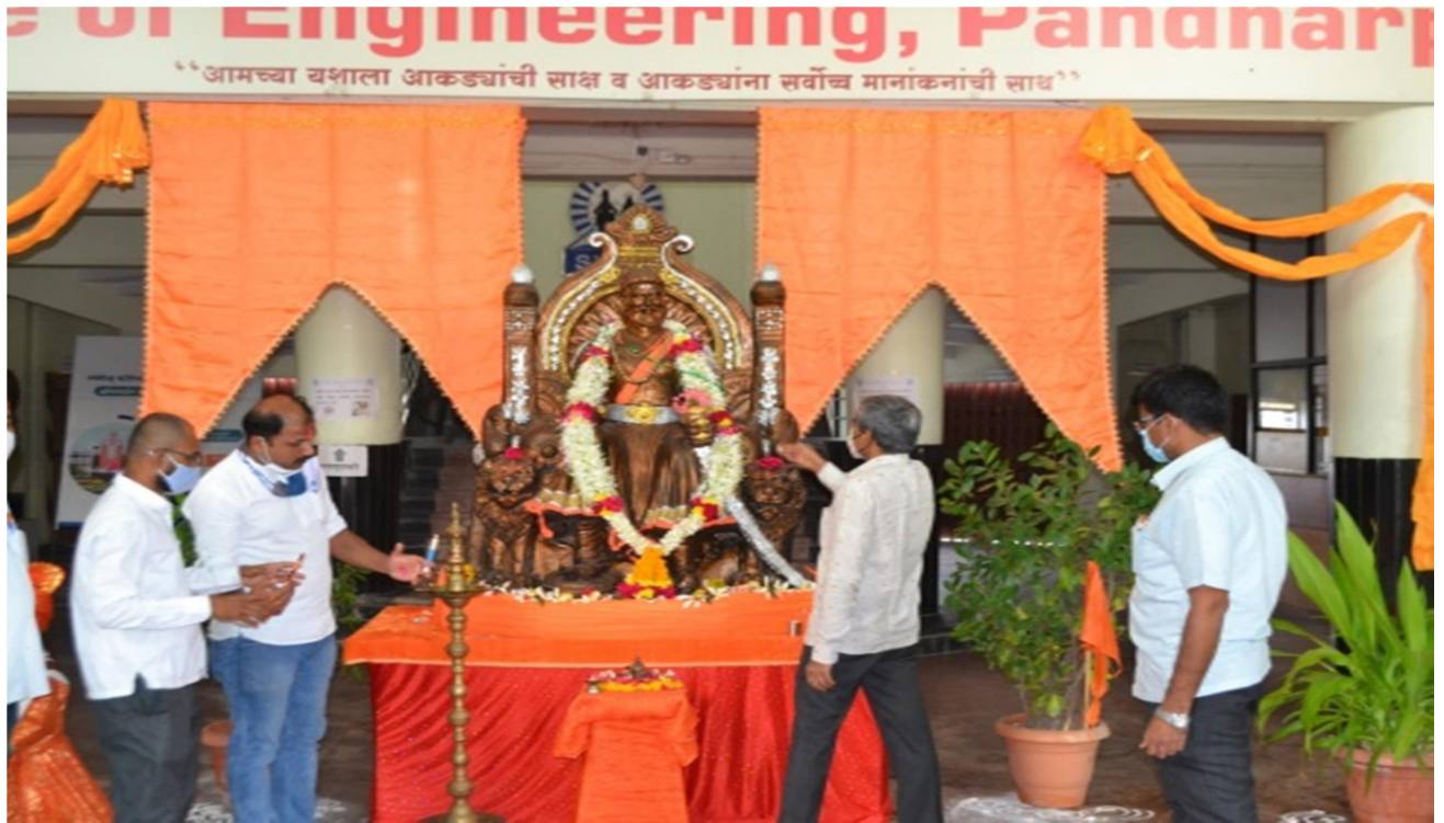
Celebration of Shivjayanti at main porch