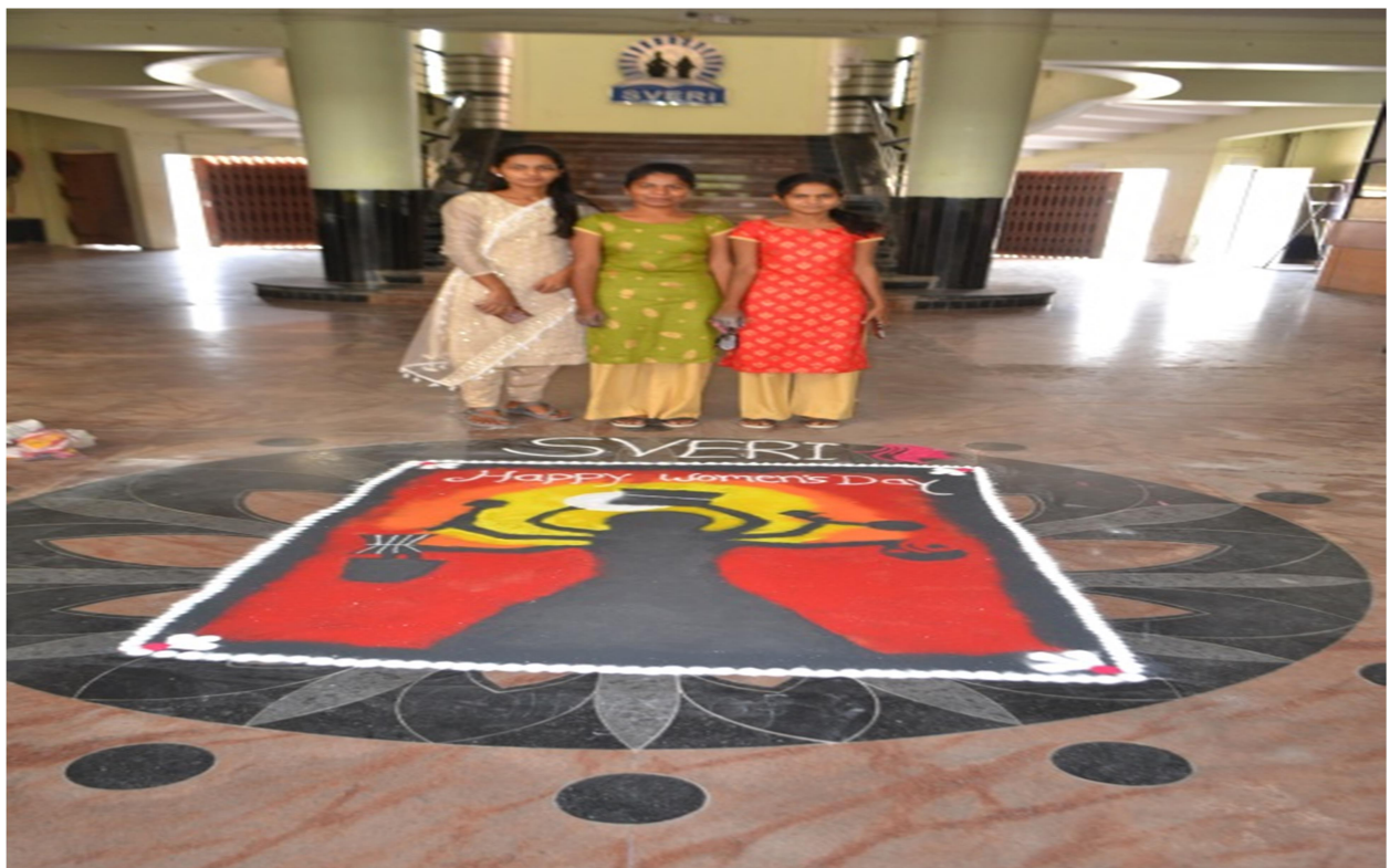
Celebration of International Women's Day