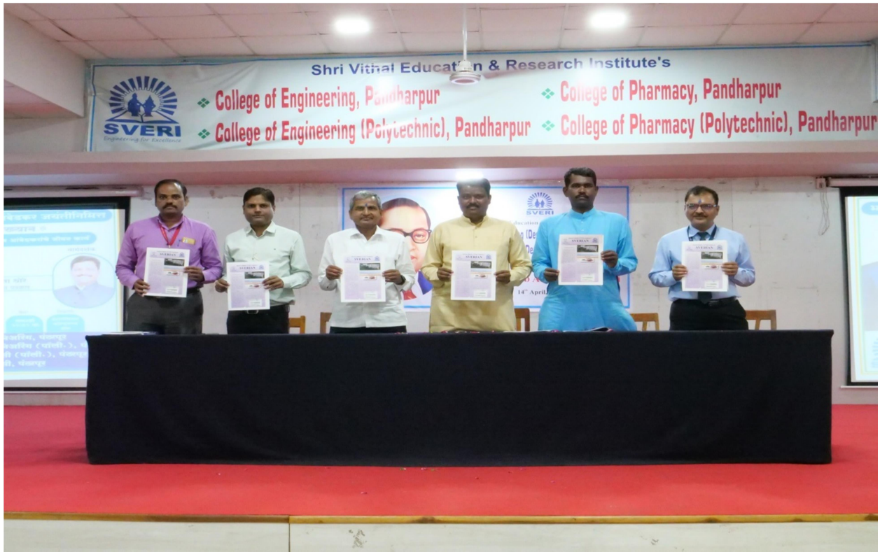
Celebration of Dr.Babasaheb Ambedkar Jayanti at International conference hall