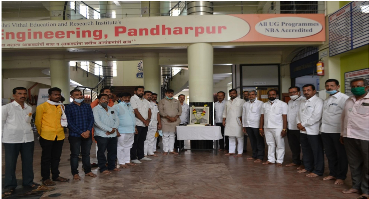
Celebration of Mahatma Phule Jayanti at main porch