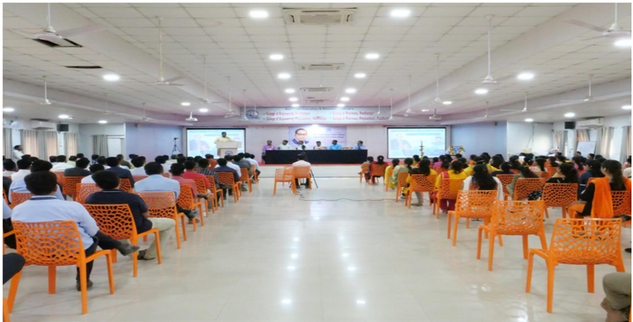
Hon.chief guest delivering speech