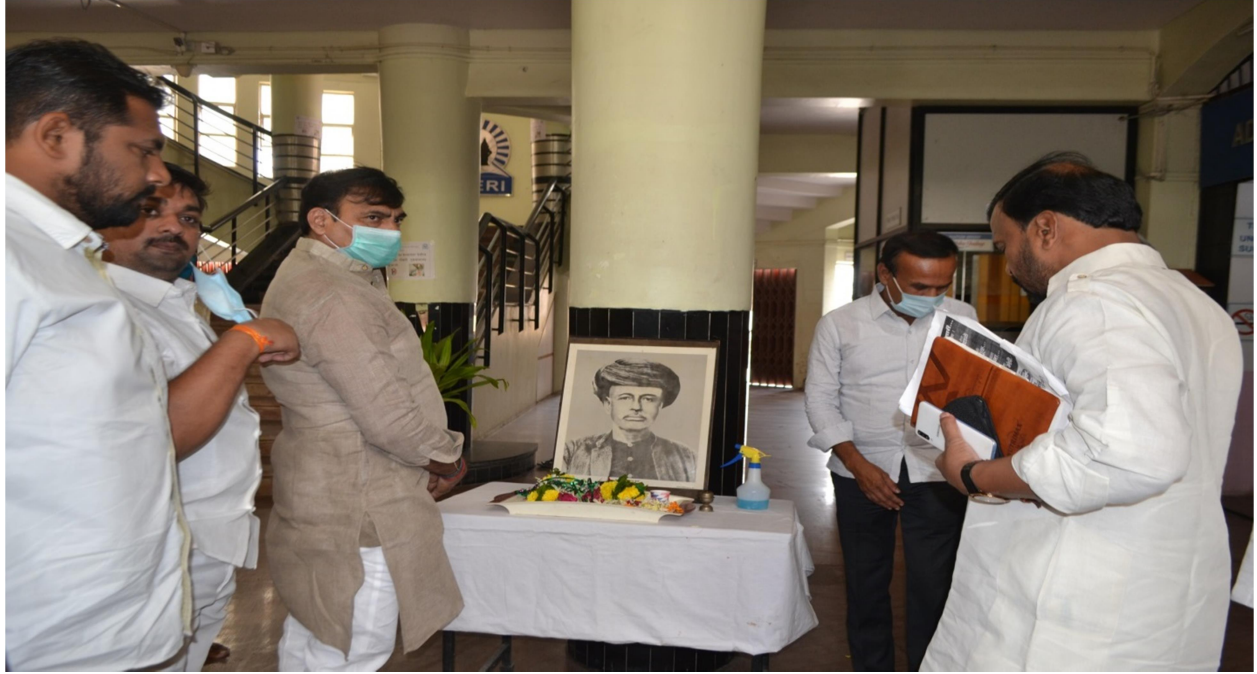
Pratima Puja on Mahatma Phule Jayanti at main porch