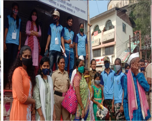
Police Mitra activity during Kartiki wari