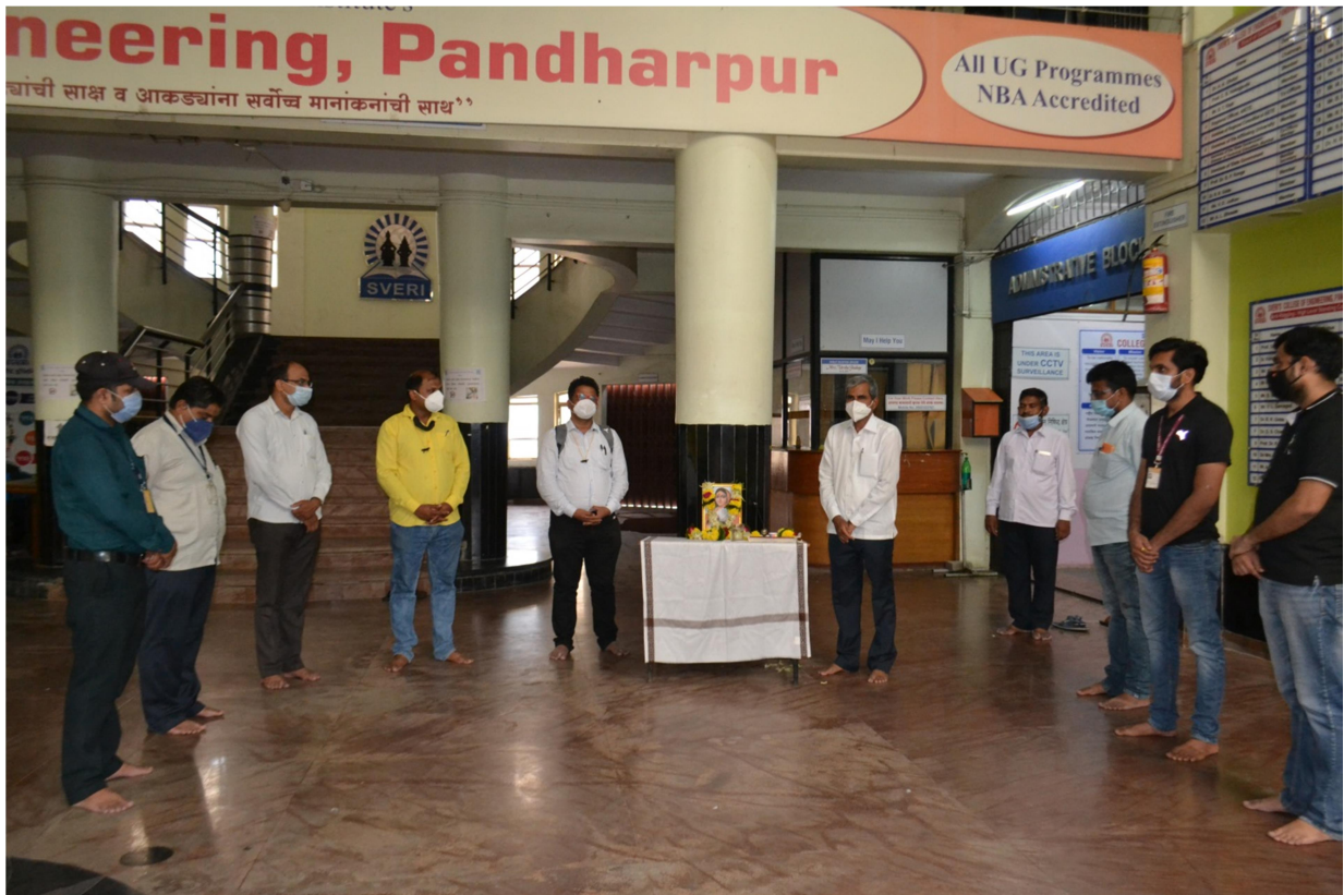
Celebration of Ahilyadevi Holkar Jayanti